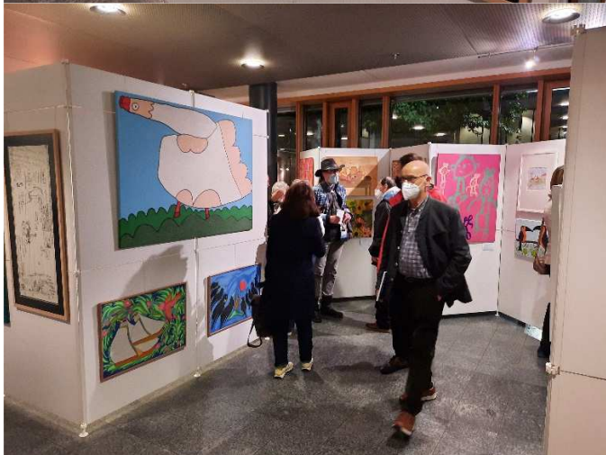
Die Besucher*innen sind beeindruckt