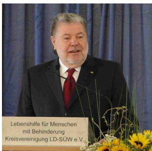
Kurt Beck, Ministerpräsident a.D.