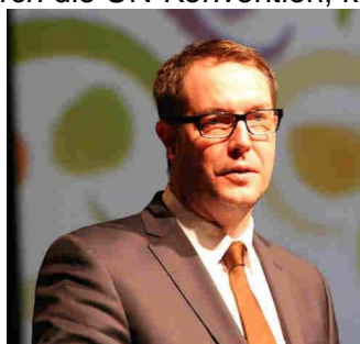
Alexander Schweitzer, Sozialminister des Landes Rheinland-Pfalz